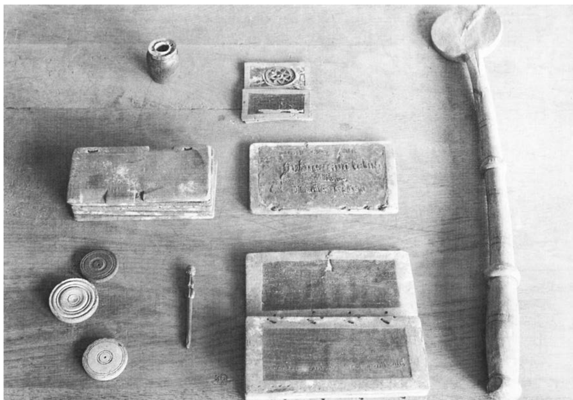
Рис. 3. Школьные предметы из раскопок Любека (Schildhauer, 1984. S. 186, abb. 143) Fig. 3. School utensils from excavations at Lubeck (Schildhauer, 1984. S. 186, abb. 143)