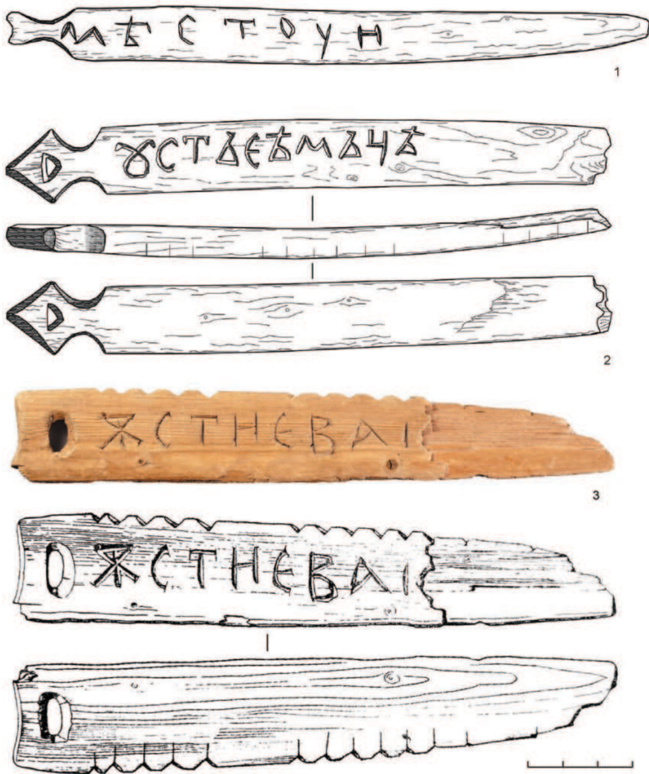
Рис. 4. Бирки с надписями, дерево: 1 — Троицкий раскоп XIII, 2010 г.; 2 — Троицкий раскоп XV, 2017 г.; 3 — Троицкий раскоп V, 1980 г. (фото и прорисовка)