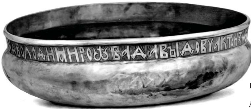
Рис. 1. Чара Владимира Давыдовича (фото).